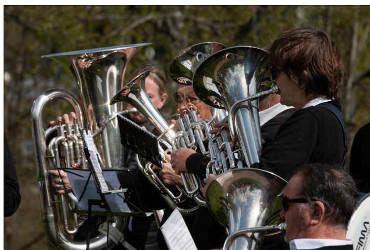
MUSIKK: Røyken Brass spilte.