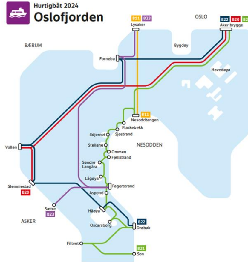
Figur 21: Linjekartet viser Scenario 3 og 4

Når E18 bygges om vil båt kunne avlaste trafikken på vei