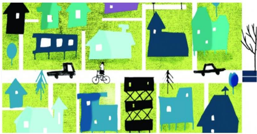
Antikorrupsjonshåndbok for kommuner, «Beskytt kommunen»