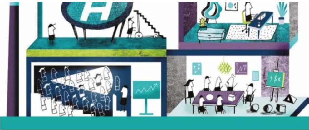
Beskytt din virksomhet – oppdatert håndbok for næringslivet