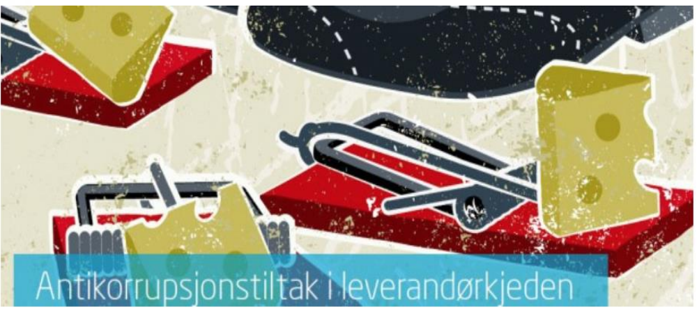
Antikorrupsjonstiltak i leverandørkjeden