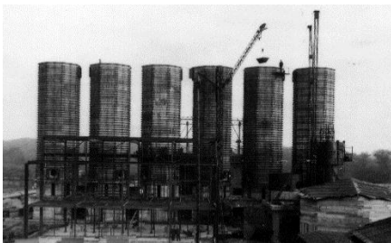
Syretårn 8 x 22m

Da en fant ut at granitten på visse steder var syreholdig åpnet det seg et enormt marked de neste desenniene, man begynte å hogge stein til bygging av syretårn og hele verden var med ett marked.