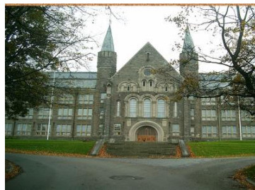
Norges tekniske Høys. Fredspalasset i den Haag